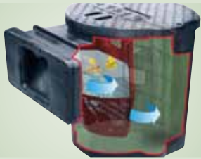
Extra großer Filterkorb für lange Reinigungsintervalle und hohe Laubmengen