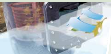
SAViO-Systeme machen die Arbeit für Sie. Der SAViO Skimmerfilter® saugt ständig die Wasseroberfläche ab. Gerade so, als ob ein Fachmann Ihren Teich täglich reinigen würde.

SAViO Skimmerfilter® sind für Teiche aller Größen geeignet und halten diese zuverlässig sauber. Durch eine präzise funktionierende Schwimmklappe saugt der Skimmer nur Oberflächenwasser an und zieht so Schmutz und Staub vom Teich. Der dahinterliegende Filterkorb nimmt große Schmutzmengen auf und verlängert die Wartungsintervalle der Filteranlagen, auch im Herbst bei stärkerem Laubeintrag. In Kombination mit den SAViO Livingponds® Wasserfall-Filtern lassen sich so Teiche bis zu 15.000 Litern ganz bequem sauber halten. Für Teichvolumen bis zu 80.000 Litern kombinieren Sie den SAViO-Skimmerfilter® mit Mehrkammer-Filtern aus dem aquiva-Programm (ab Seite 124). Das Skimmergehäuse kann gleichzeitig als Pumpenkammer dienen. Durch die stabile Bauweise ist der Skimmerfilter unproblematisch im Erdreich verbaubar. Einlauföffnungen, die auf die jeweilige Teichgröße abgestimmt sind, bieten für jeden Teich eine saubere Lösung.